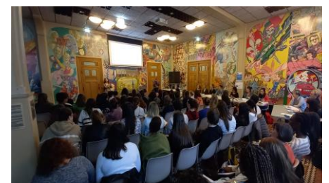
La présentation du fonctionnement du CCAS par son directeur adjoint