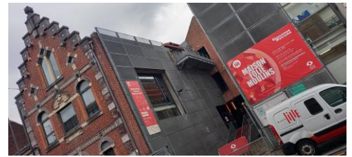
La maison folie de quartier Moulin

C'est un lieu de médiation culturelle, que nous, BTS SP3S, avons pu visiter lors d'un séjour professionnel. Il y a 2 maisons Folie situées au même endroit : "la maison Folie Moulin" qui met en avant des spectacles, concerts, et expositions. Puis, "la maison Folie Wazemmes" qui propose des spectacles (danse, théâtre, performances et cabarets), des concerts, expositions et des ateliers de pratiques artistiques.