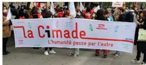
Manifestation de bénévoles de la CIMADE

Cette association permet l'accès aux droits et aux soins des réfugiés et migrants qui sont sans papiers ou en rupture de droit.