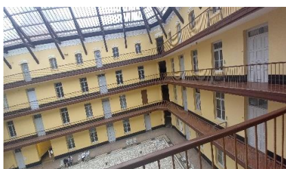
La cour intérieure du familistère